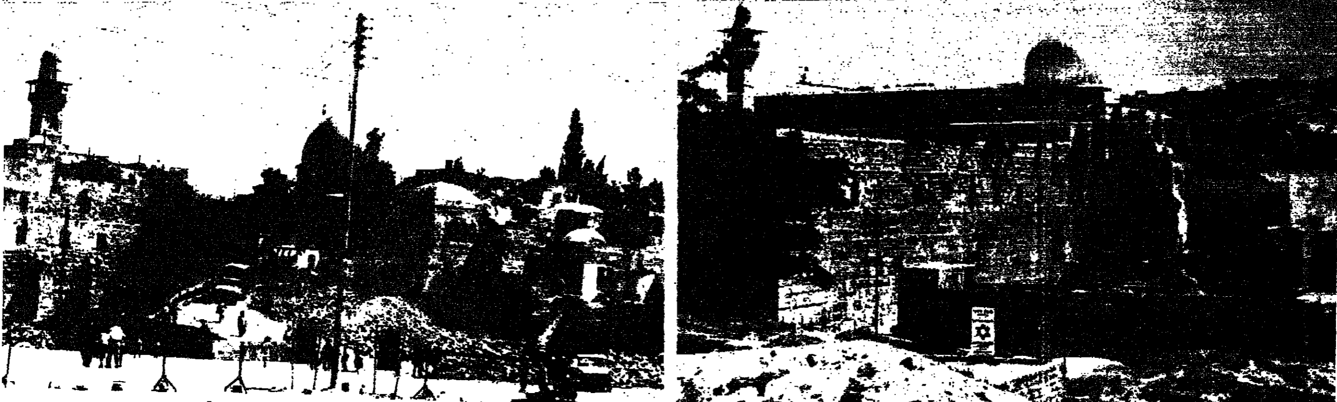
سورتان خاصتان باللبنون من القدس بينان عمليات الهدم التي يقوم بها الإسرائيليون على مقربة من أسوار الحرم القدسي الشريف . وتلاحظ بعض المباني الموجودة في الصورة الأولى « ألي الجين » بينما أزيلت في الصورة الثانية .